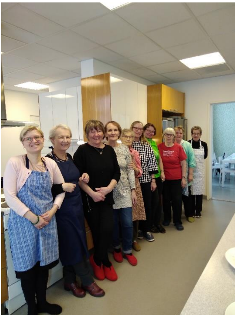
Säynätsalon Martat, Kalakurssilla

Yhdistyskuulumisia. Pitkästä aikaa on päästy viettämään aikaa yhdessä ruokakurssien merkeissä. Marttakeskuksessa ovat käyneet: Keski-Jyväskylän Martat, Jyväskylän Kaupunkimartat, Säynätsalon Martat ja Kortepohjan Martat. Lisäksi maakunnassa on käytä moikkaamassa Suolahden Marttoja. Saarijärven Martat kokoontuivat Martta-illassa, kirjallisuus-teemalla, samalla myös tutustuivat Keski-kirjaston sähköiseen toimintaan.