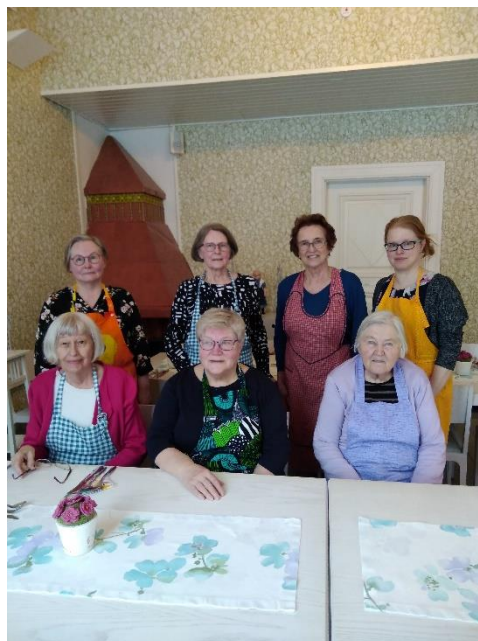
Kortepohjan Martat, kasvisruokakurssi