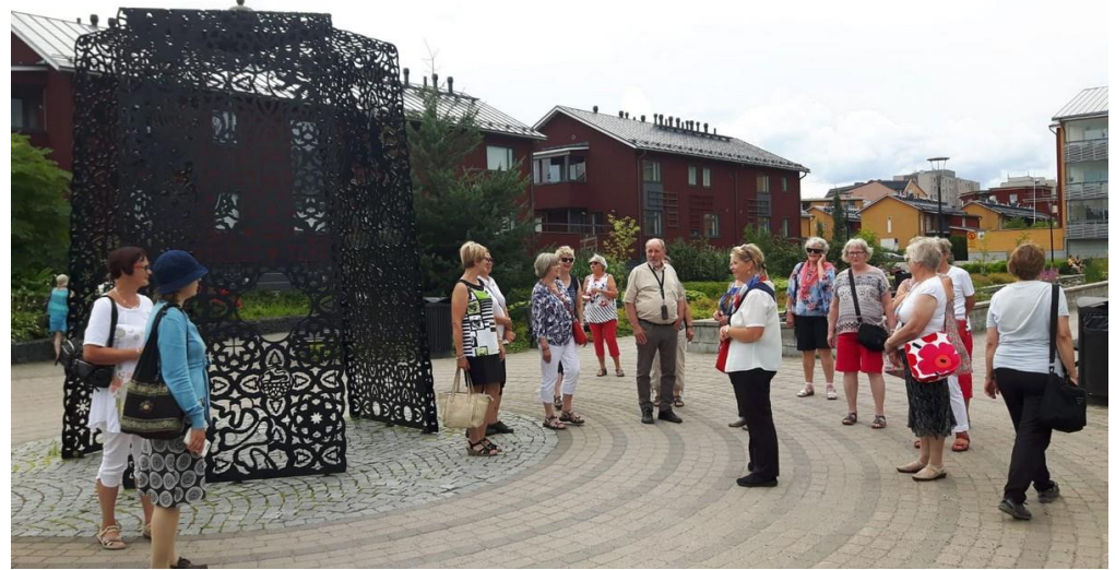
Porvoon kierrokselta ja Haikon kartanon kuva. Omia ja Sirpan kuvia