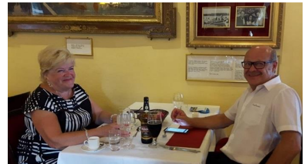
Sirpan kuva Muumimammasta ja Muumipapasta Haikon illallisella!