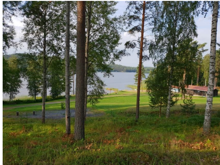
Illallinen Anttolanhovissa ja Saimaan rantaa