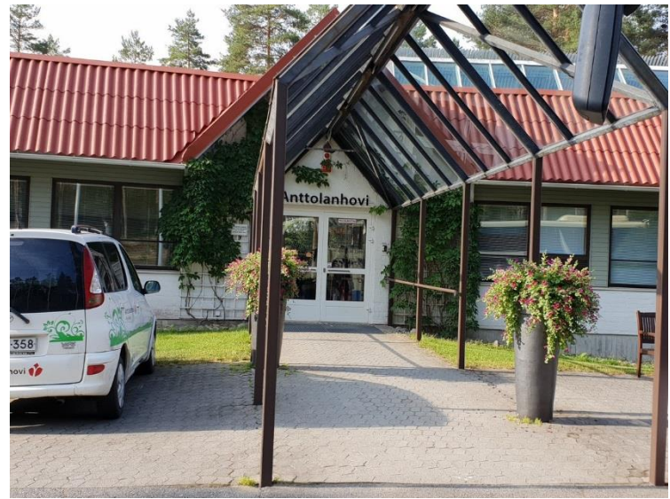
Anttolanhovin päärakennus ja Haminan kuvia