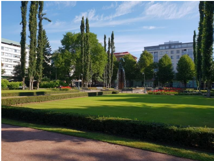
Kotkan puistonäkymä, vedenjakelupiste ja pyöränhuoltopiste