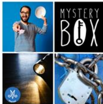
Mystery Box -Huonepakopeli Varautumisen taidot haattuun hauskalla tavalla!

Tilaa Mystery Box -pelielämys ryhmällesi! Lisätietoa: Mystery Box | Martat