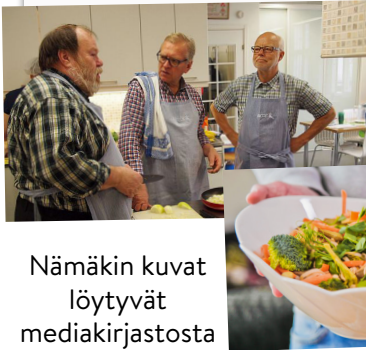
Nämäkin kuvat löytyvät mediakirjastosta