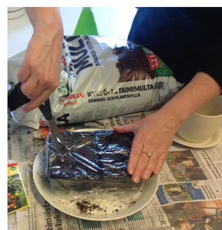
Peitä kylvös rei'itetyllä muovilla