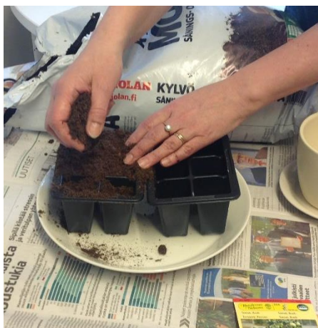
Täytä potit kylvömuullalla