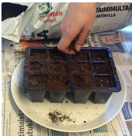
Peitä siemenet ohuella multakerroksella