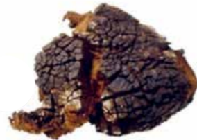
Ötziin laukusta löytynyt kääpä.

»Sienet ovat kiinnostavia, jännittäviä, jopa pelottavia. Niitä on oikeastaan lähes kaikkialla ja ne ovat eläneet maan päällä jo tosi pitkään.