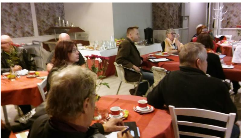
Aktiivisia keskustelijoita kyläpäällikkötapaamisessa 8.10. Simpeleellä.