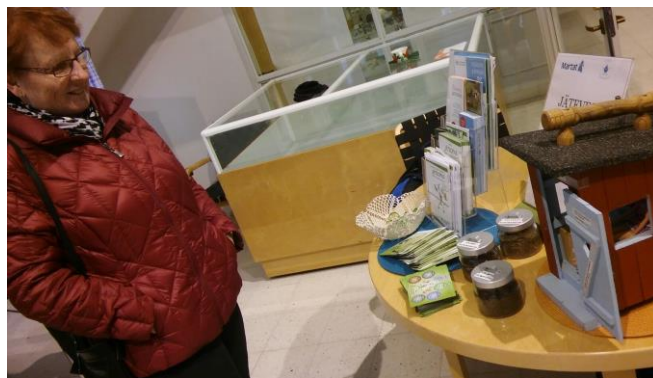
Neuvontaa Imatran pääkirjaston ala-aulassa.

Etelä-Karjalan jätehuolto Oy:n kanssa tehtiin kompostointi- ja lajitteluneuvonnan yhteistyötä, joka nivoutui luontevasti jätevesineuvontaan. Etelä-Karjalan Martat on mukana Etelä-Karjalan ympäristökasvattajien työryhmässä. Kaakkois-Suomen ELY-keskukselta on ollut lainassa pienoiskoossa oleva, linnunpöntön kokoinen huussi. Se edelleen pysäyttää eri-ikäisiä asiakkaita ja havainnollistaa kuivakäymälän hoitoon liittyvissä kysymyksissä.